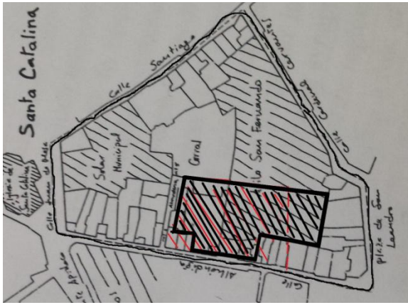
1940 (S.XX) Mapa 6.

En esta figura por primera vez aparece la Iglesia de Santa Catalina separada de la manzana.