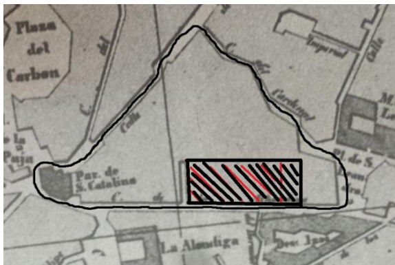
1848 (S. XIX) Mapa 2.

El edificio situado en la parte superior izquierda era uno de los conventos que más tarde sufrieron la desamortización (proceso por el cual se dejaban a disposición pública los bienes heredados por la iglesia).