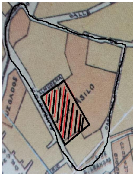
1910 (S.XX) Mapa 5.

Y en uno de los extremos de la imagen el edificio que hay marcado en oscuro es la Iglesia de Santa Catalina (2) que en esta época estaba unida a la manzana.