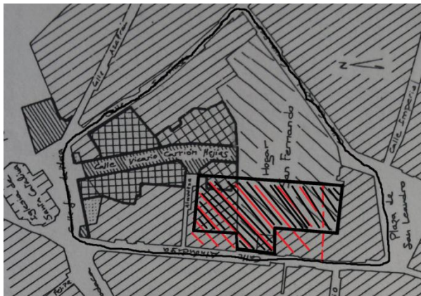
1958 (S.XX) Mapa 7.

También divisamos un corral de vecinos que tenía acceso por la c/Almudena y que desaparecerá con la remodelación de la manzana.